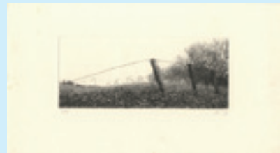
268 吉田勝彦 颱風一過 銅版 限 80 サイン 9.5×23.2 昭和 57 年 (1982) 8,000 円