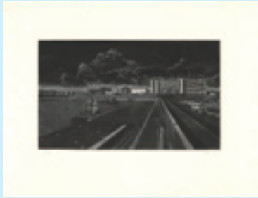
261 吉田勝彦 作品 銅版 限 50 サイン 21.5×36 25,000 円