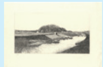
273 吉田勝彦 小野川の春 銅版 限 80 サイン 弱い アタリ マージン極少シミ 10×29.5 昭和 57 年 (1982) 8,000 円