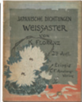
316 ア・ローイドカ・フロレンツ (Karl Florenz) (独) 孝女白菊の詩 鈴木華邨・新井芳宗画 チリメン本 木版 刷良 保存良 帙(木版装・背ヤケ・爪1個欠) 長谷川武次郎刊 19.3 × 14.5 明治28年(1895) 45,000円