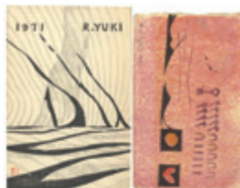
260 由木礼 木版賀状 2 通 昭和 40・46 年 (1965・71) 8,000 円