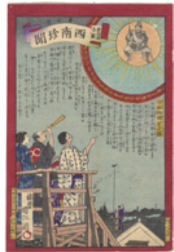
321 国政 鹿児島各県西南珍聞 第 7 号 刷良 保存良 1 ヶ所薄ミ ※望遠鏡の図 明治 10 年 (1877) 35,000 円