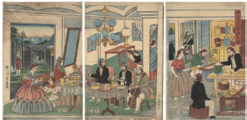
302 芳員 横濱異人屋敷之図 3枚続 刷良 保存並 中折レ 左図上部傷ミ補修 一部少汚レ文久元年 (1861) 95,000 円