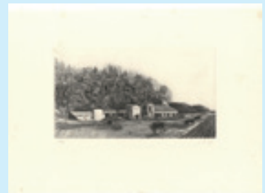
266 吉田勝彦 牛舎のある風景 銅版 限 80 サイン マージン 少シミ 13.5×23.3 昭和 57 年 (1982) 10,000 円