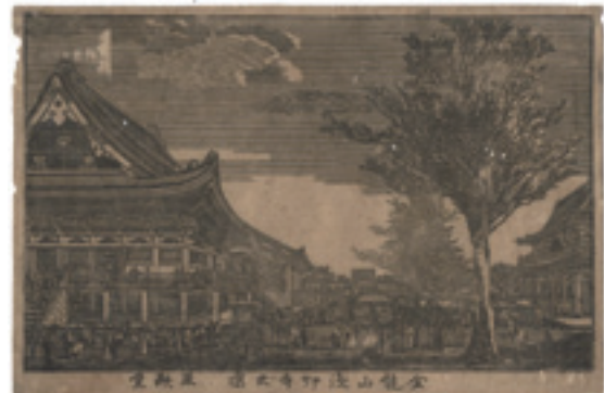
323 亜欧堂田善 金龍山浅草寺之景 銅版 刷良 保存並 裏打 少点虫穴 経年汚レ 12.5 × 19.2 (紙サイズ) 寛政・文化頃 (1789-1818) 120,000 円