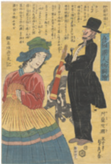
303 貞秀 五箇国人物図会 阿蘭陀国 刷良 保存並 シワ 虫穴補修 ※犬・望遠鏡の図 文久元年 (1861) 35,000 円