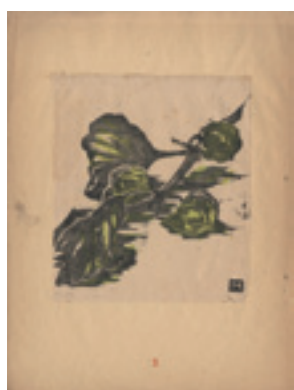
256 吉田正三 ほおづき 木版 新版画第 10 号 (第 3 回展覧会開催 記年号) より 少シミ 17 × 14.7 昭和 8 年 (1933) 5,000 円