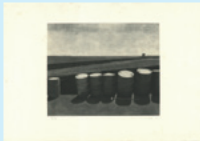
265 吉田勝彦 夏 銅版 限 80 サイン マージンシミ 20.5×25.3 昭和 56 年 (1981) 15,000 円