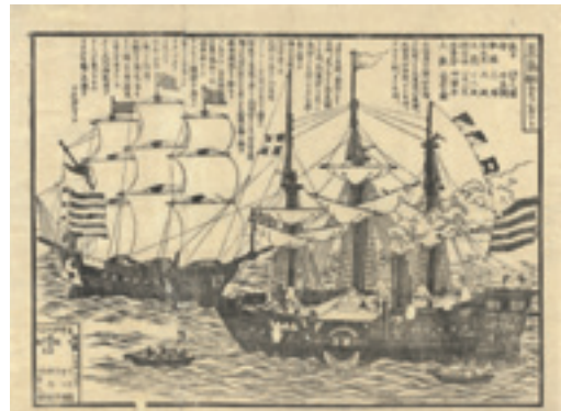
325 作者不詳 瓦版 蒸気船本名フレガット 刷良 保存良 裏打 少虫穴 32 × 44.3 嘉永頃 (C1853) 100,000 円