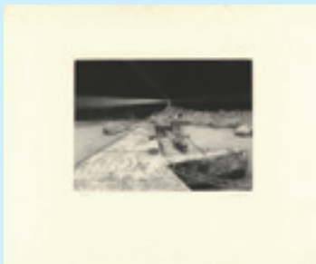
267 吉田勝彦 小さな港 銅版 限 100 サイン マージン 極少シミ 15.6×20.3 昭和 56 年 (1981) 12,000 円