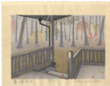
249 山高登 霧の軽井沢 木版 限 100 サイン 22 × 32.2 20,000 円