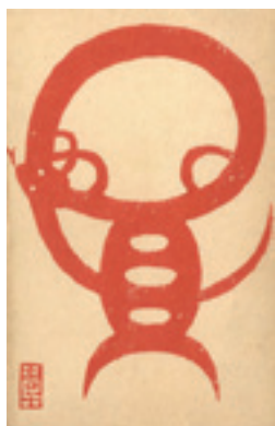
257 吉田遠志 木版賀状 1 通 昭和 40 年 (1965) 3,000 円