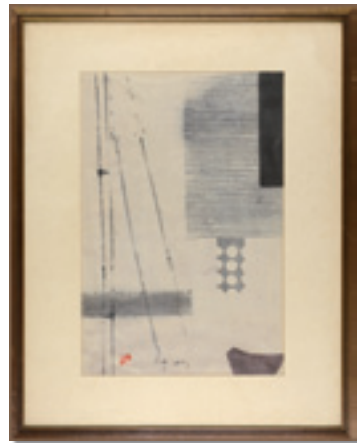
247 山口源 作品 木版 刷込サイン 35 × 23.5 (画面サイズ) 額装 50,000 円