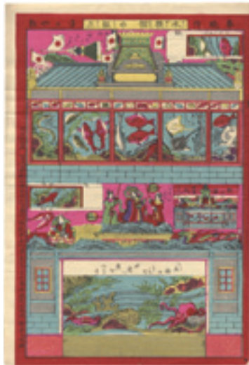
320 春暁 水族館の組立 刷良 保存良 中折レ 平のや板 明治 37 年 (1904) 50,000 円