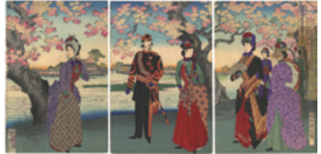
312 周延 墨田花高貴ノ遊覧 3枚続 刷良 保存並 裏打 トリミング 右図シミ ※洋装の図 明治21年(1888) 25,000円