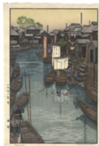
258 吉田遠志 浦安 木版 サイン 37 × 24.2 昭和 26 年 (1951) 25,000 円