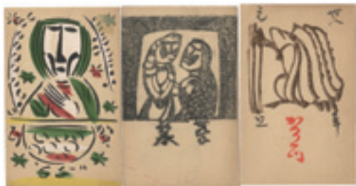
278 渡辺禎雄 木版賀状 3 通 (手彩 1 通) 昭和 36・39・40 年 (1961・ 64・65) 12,000 円