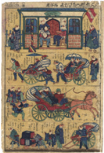
319 芳藤 志ん板猫のたわむれ 西洋床 刷良 保存並 端部傷ミ ※床屋・人力車の図 江戸 - 明治期 50,000 円