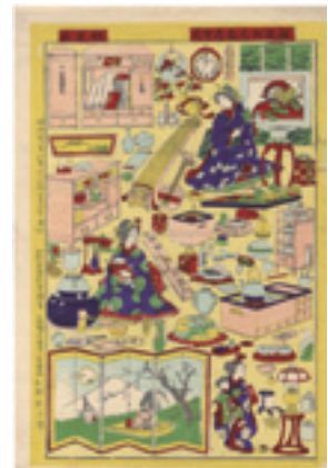
318 作者不詳 新板お座敷道具尽 刷良 保存並 折レ ※時計・洋燈の図 明治28年(1895) 8,000円