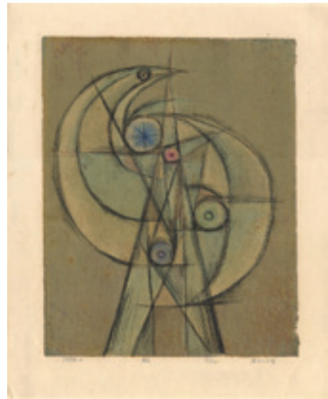
275 若山八十氏 粧 孔版 限 12 サイン マージン少シワ・ 薄シミ 38 × 30 昭和 45 年 (1970) 20,000 円