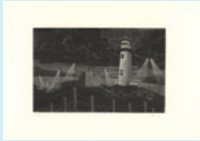
262 吉田勝彦 作品 銅版 限 50 サイン マージンに 1カ所薄い点シミ 20.8×35.5 25,000 円