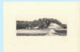
269 吉田勝彦 早春 銅版 限 80 サイン マージン 薄シミ 8.5×21 昭和 57 年 (1982) 6,000 円