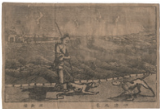
324 亜欧堂田善 佃浦風景 銅版 刷良 保存良 裏打 少点虫穴 経年汚レ 12.5 × 18.8 (紙サイズ) 寛政・文化頃 (1789-1818) 180,000 円