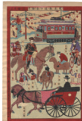
317 作者不詳 電車鉄道并二乗物尽 刷並 保存良 ※自転車 の図 明治37年(1904) 15,000円