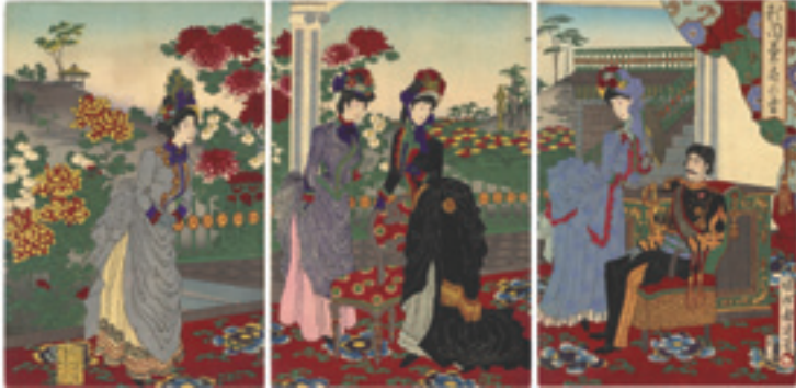
313 周延 秋園菊花の盛 3枚続 刷良 保存良 裏打 トリミング ※洋装の図 明治20年(1887) 45,000円