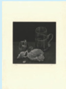
271 吉田勝彦 静物' 80-1 銅版 限 80 サイン マージン極薄シミ 20×20.5 昭和 55 年 (1980) 18,000 円