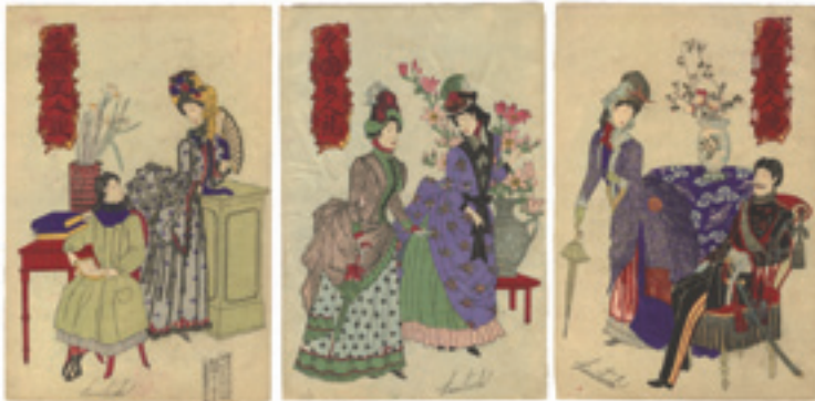
314 国利 皇国美人鏡 3枚組 刷良 保存良 裏打 トリミング 少シミ 1枚シワ ※洋装の図、作家名ローマ字 明治21年(1888) 45,000円