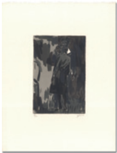
276 横尾忠則 MON CHERI リトグラフ 限 100 サイン 21 × 14 昭和 58 年 (1983) 12,000 円