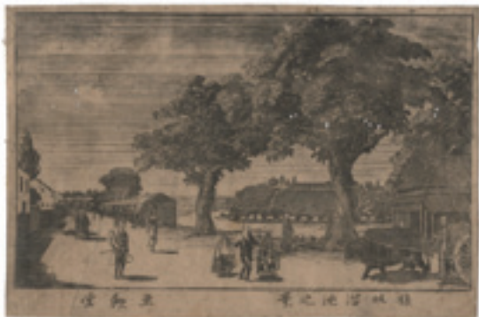
322 亜欧堂田善 榎坂溜池之景 銅版 刷良 保存並 裏打 少点虫穴 経年汚レ 12.5 × 19 (紙サイズ) 寛政・文化頃 (1789-1818) 150,000 円