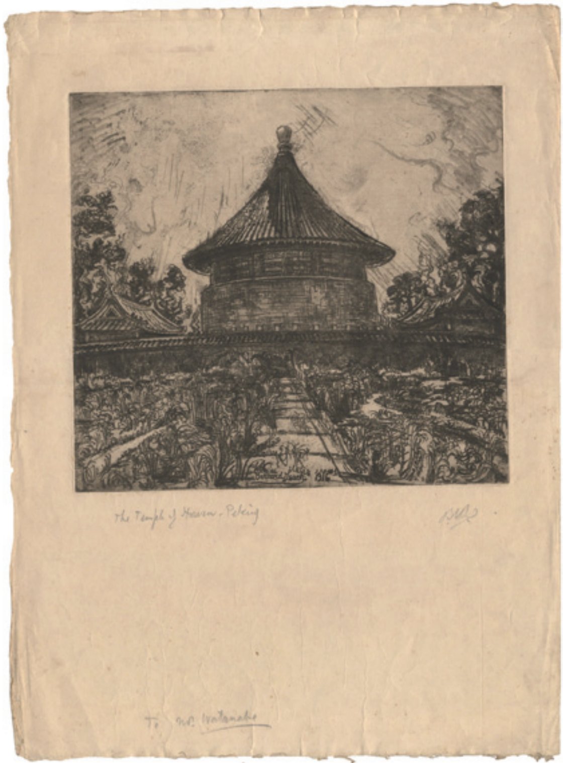
280 バーナード・リーチ 北京天壇

銅版 渡辺六郎宛署名入 マージン折レ・端部傷ミ 経年シミ 27.5×29.8 (紙51×38) 大正5年(1916)