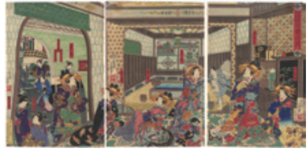
301 芳幾 江戸町二丁目甲子屋浴室之図 3枚続 刷良 保存良 トリミング 端部傷ミ 少シミ 明治3年(1870) 50,000 円