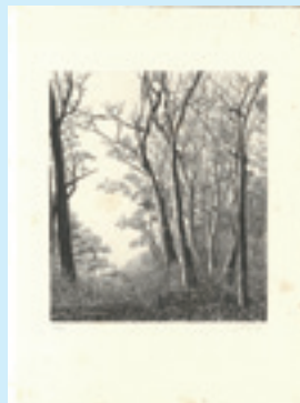
272 吉田勝彦 雑木林 銅版 限 80 サイン シミ 23.6×20.3 昭和 57 年 (1982) 5,000 円