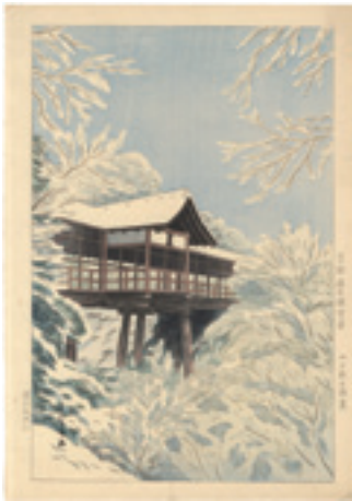
246 山下新太郎 京都通天橋雪景 木版 加藤版 36.5 × 24 昭和 25 年頃 (C1950) 40,000 円