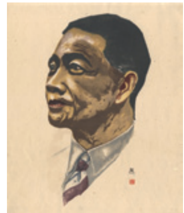
251 山口進 大東亜会議列席代表像 「汪兆銘 (中国)」 木版 サイン 経年薄シミ 46 × 38.5 (紙サイズ) 昭和 18 年 (1943) 65,000 円