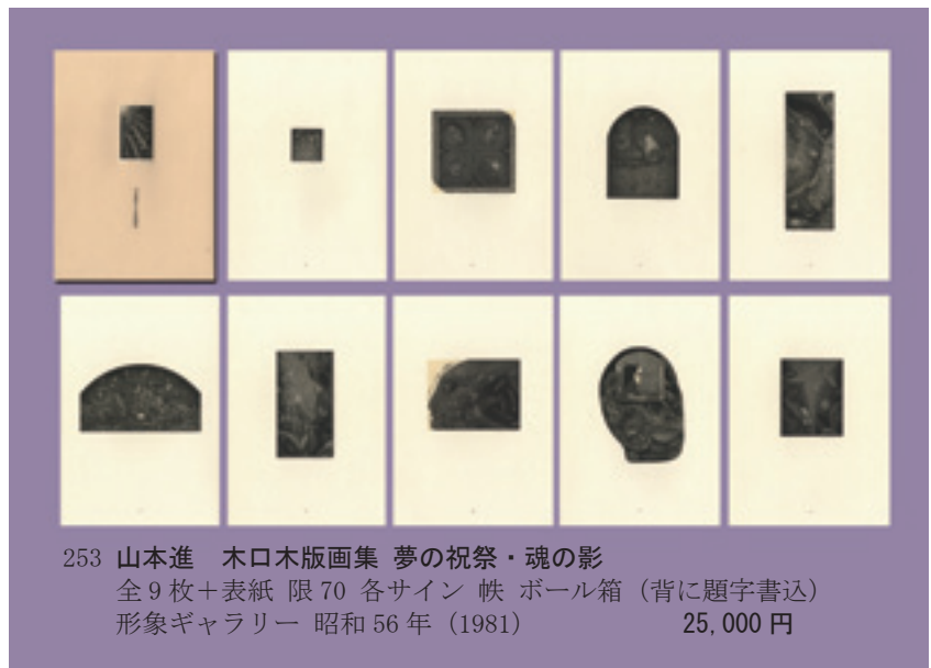
253 山本進 木口木版画集 夢の祝祭・魂の影 全 9 枚 + 表紙 限 70 各サイン 帙 ボール箱 (背に題字書込) 形象ギャラリー 昭和 56 年 (1981) 25,000 円