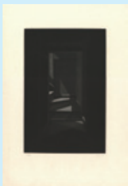
270 吉田勝彦 四獣視姦思考より 銅版 限 80 サイン マージン極薄シミ 30.5×20 18,000 円