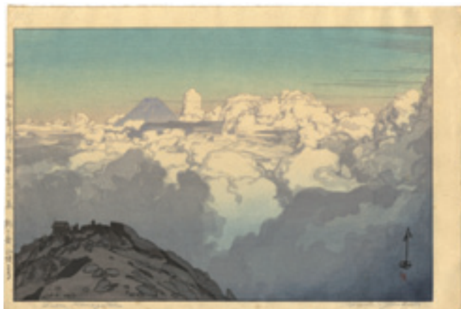
255 吉田博 日本南アルプス集 駒ヶ岳山頂より 木版 自摺 サイン マージン少薄シミ 24.7 × 37.8 昭和 3 年 (1928) 280,000 円