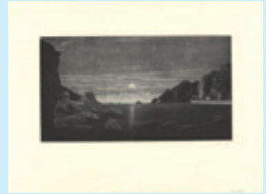
263 吉田勝彦 夜明けの越前海岸 銅版 限 70 サイン 19.5× 35.5 25,000 円