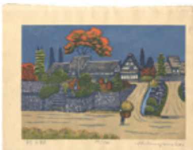
252 山高登 村の秋 木版 限 100 サイン 22 × 32.2 25,000 円