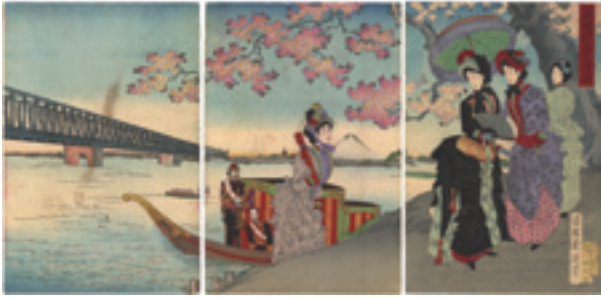
311 周延 隅田川花の遊覧 3枚続 刷良 保存良 裏打 トリミング 中・左図シミ ※洋装の図 明治20年(1887) 25,000円